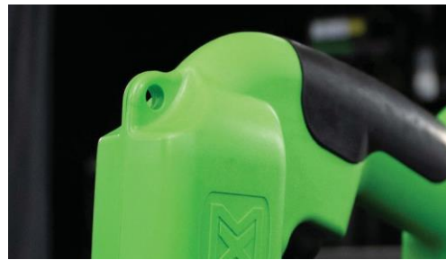
Отвор за ремъка